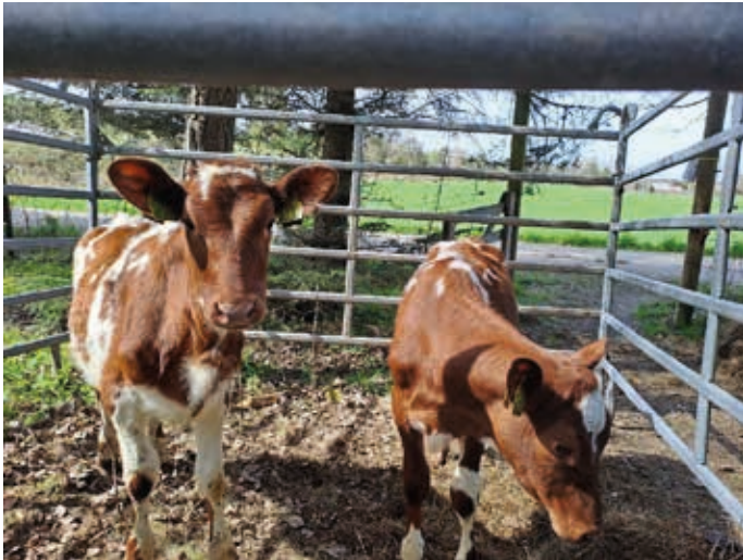
Kalvene fra Tomb Jordbruksskole på vår stand

Videregående elever fra Naturbruksskolene i Buskerud, Akershus, Oslo og Østfold deltar i konkurranser og får poeng. Det er lagt en løype, og vi var en av postene. Vi hadde spørsmål om kuraser – noe mange syntes var vanskelig. I tillegg skulle de peke på spesielle deler på kua.