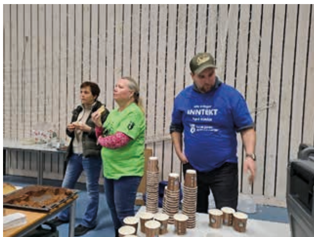
To av våre medlemmer som serverer kaffe