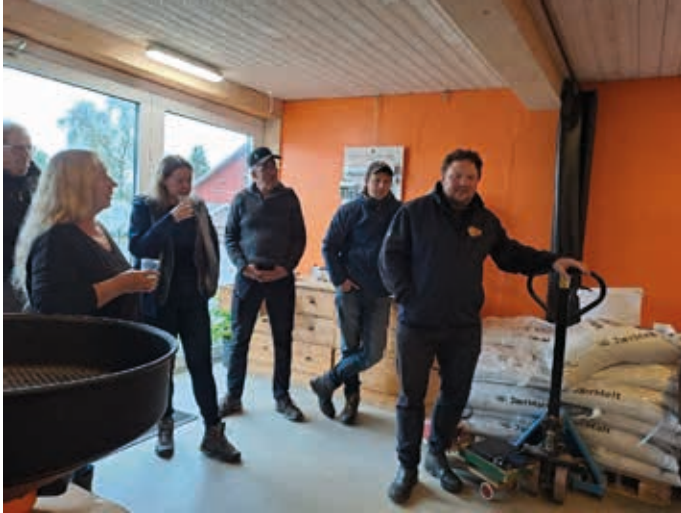
Noen av deltakerne